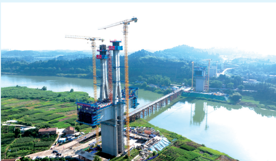
工人在给成达万高速铁路资阳沱江特大桥10号塔灌注混凝土(无人机照片)。